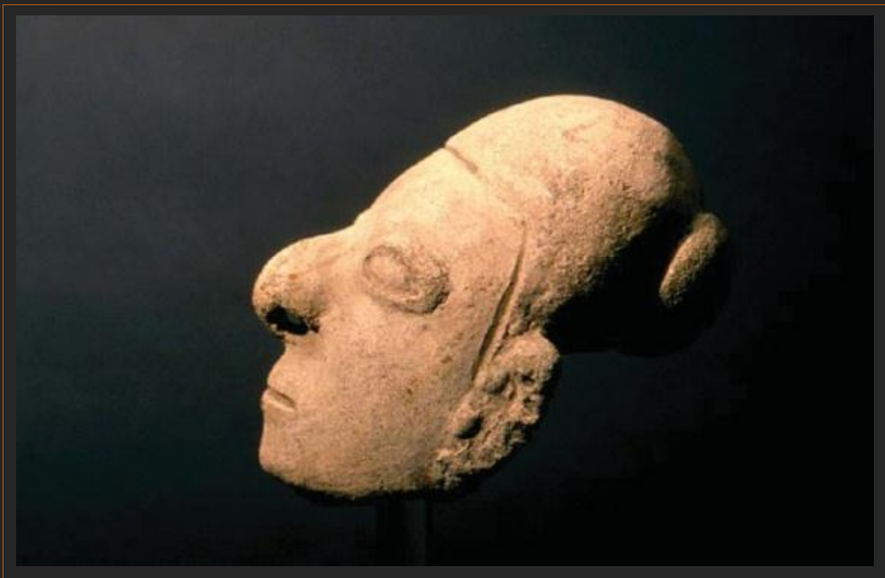
retrato miniatura Tumaco / 6 x 5 x 4 cms. aprox