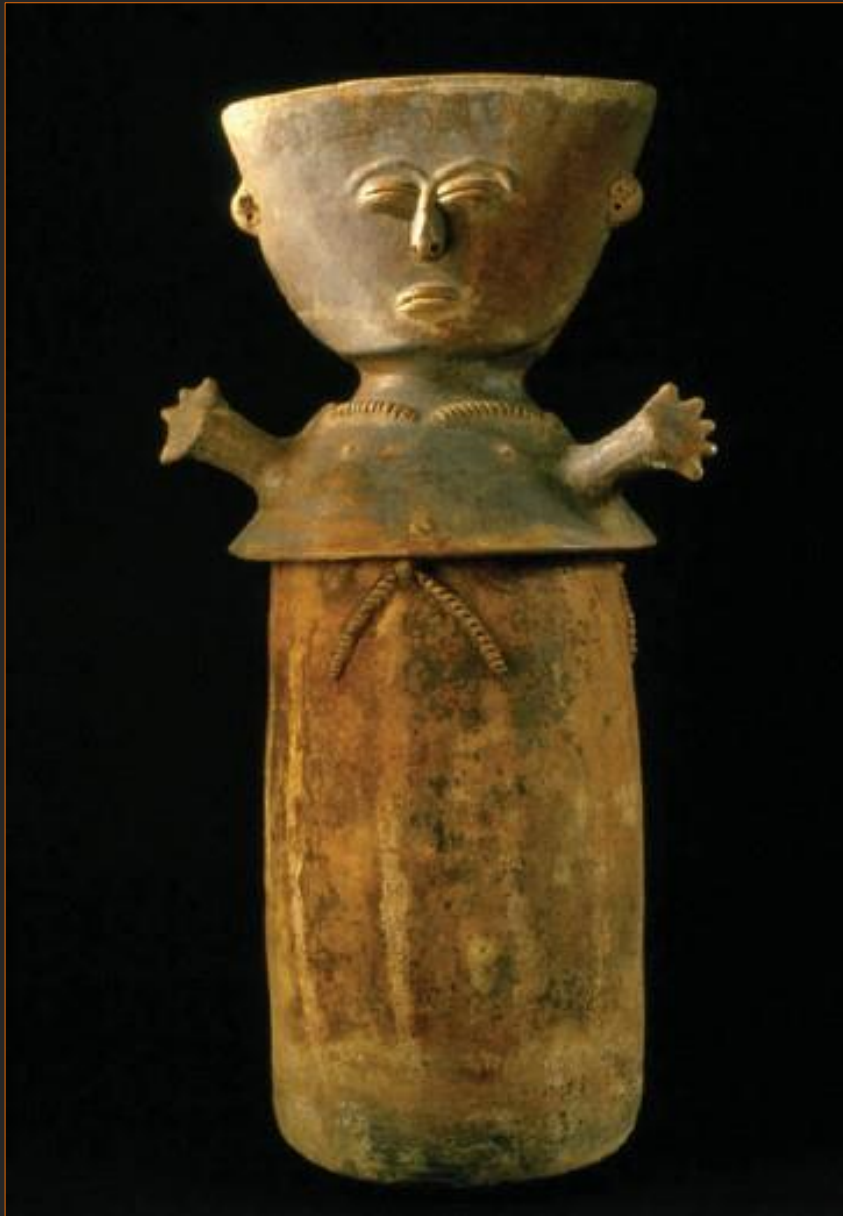
urna funeraria Río Magdalena / 79 x 40 cms. aprox.