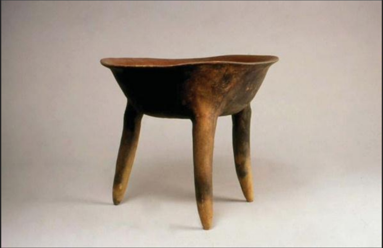
plato con soporte trípode San Agustín / 27 x 24 cms. aprox.