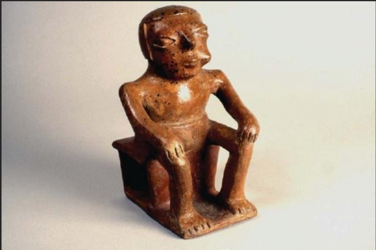
personaje Nariño / 19 x 13 x 12 cms. aprox.