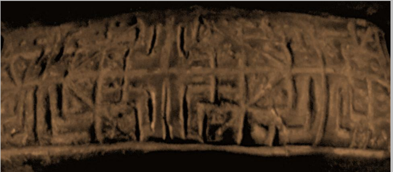
trazos incisos Sinú