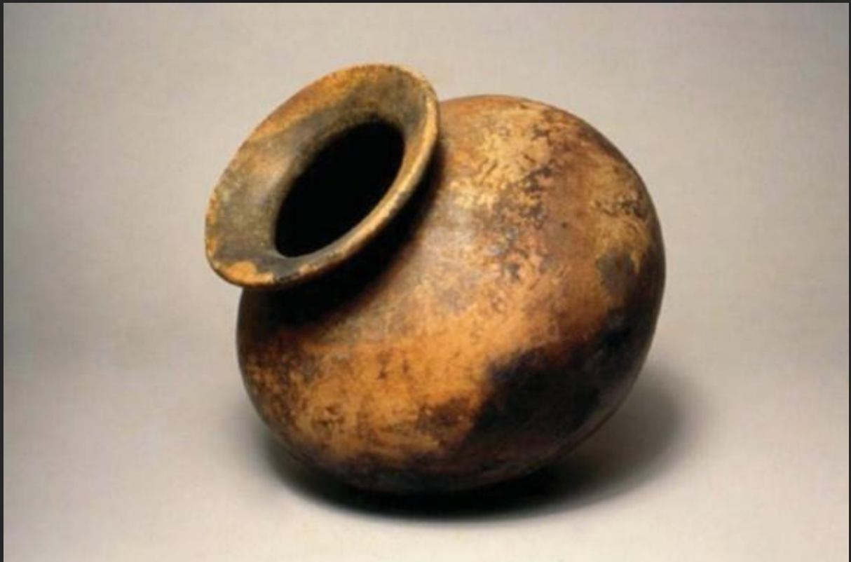
vasija Tierradentro / 24 x 22 cms. aprox