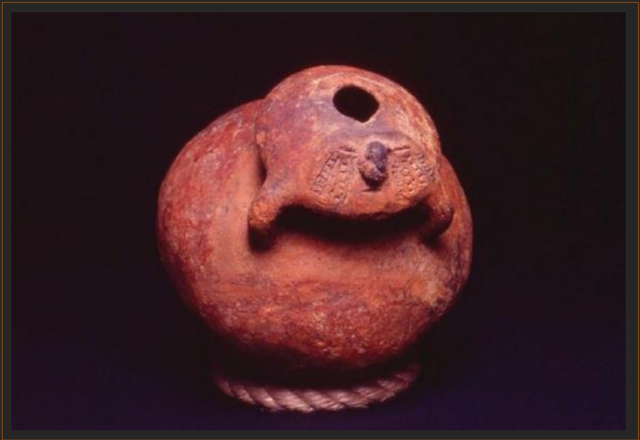
pieza antropomorfa Cauca / 22 x 21 cms.