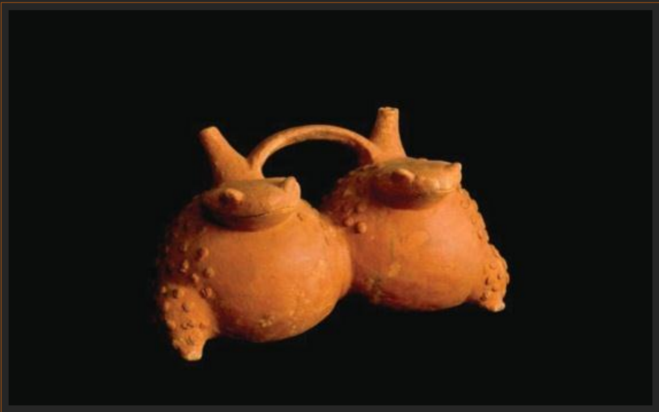
alcarraza antropomorfa Calima / 23 x 14 x 13 cms. aprox.