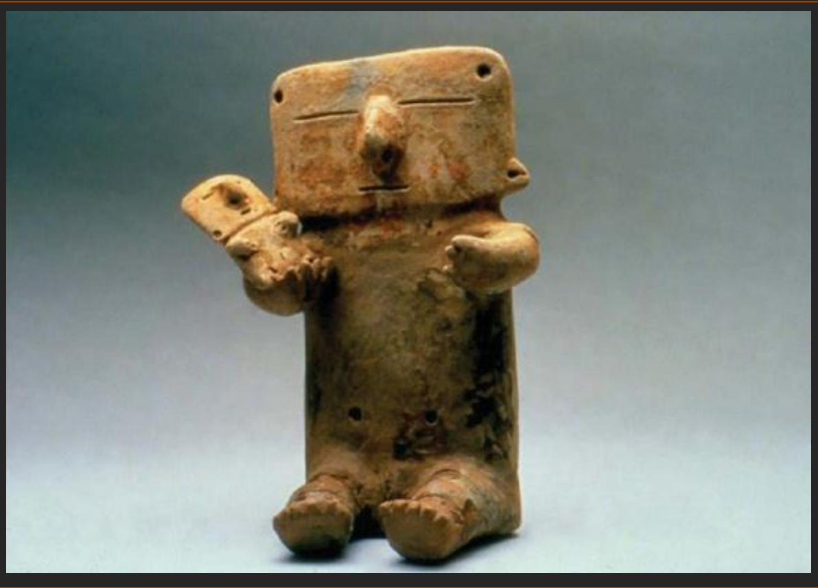
pieza antropomorfa Quimbaya / 28 x 21 cms. aprox.