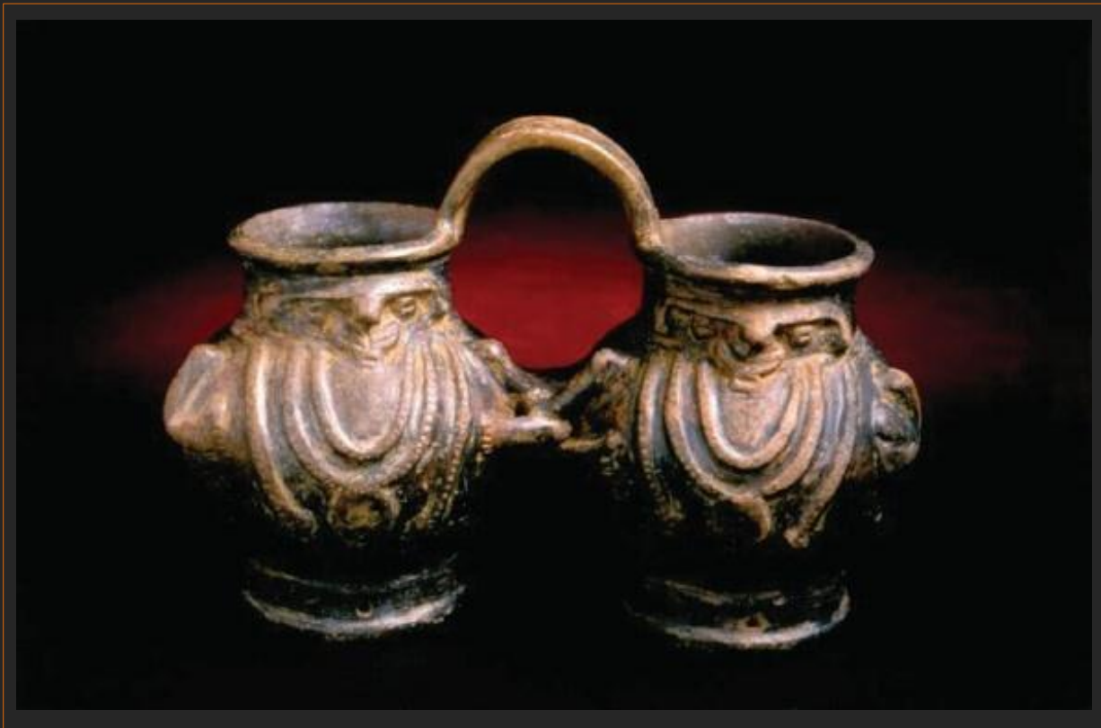
vasija doble antropomorfa Tayrona / 24 x 17 x 11 cms. aprox.