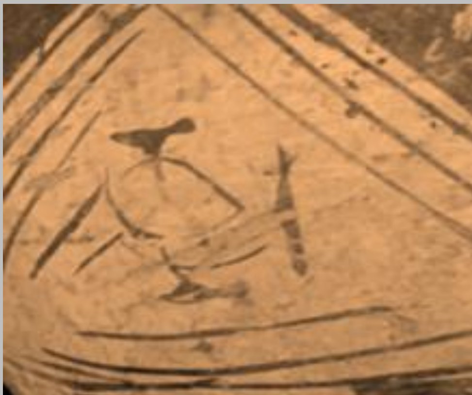
trazos gráficos Guane