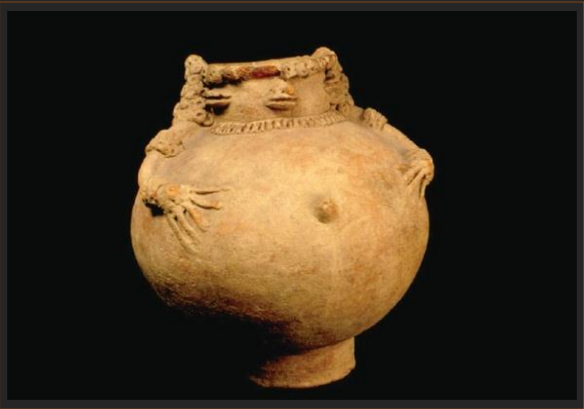
vasija antropomorfa Chimila / 21 x 20 cms. aprox.