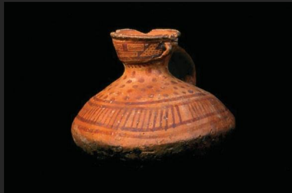
vasija decorada antropomorfa Muisca / 14 x 14 13 cms.